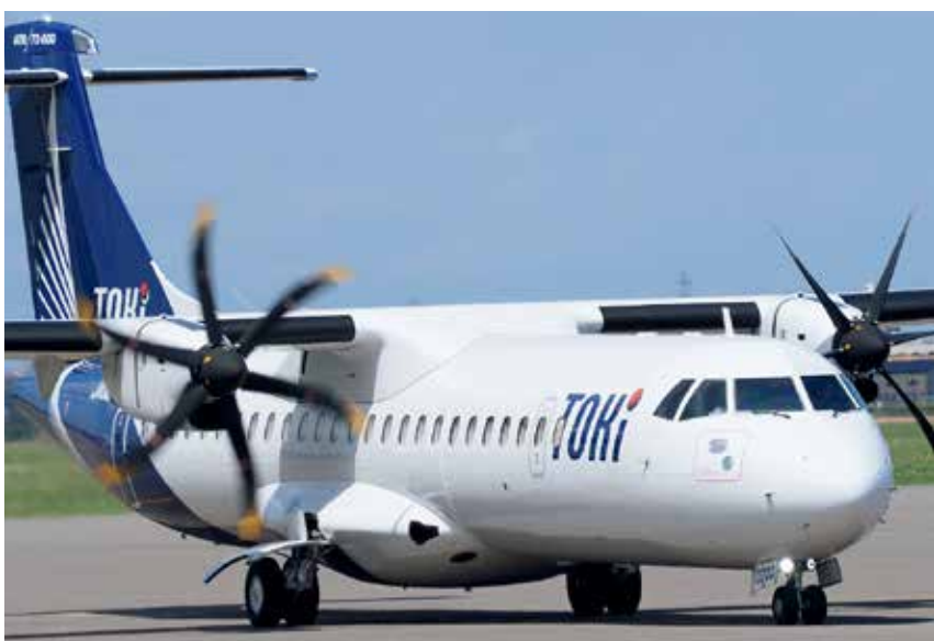
仙台―新潟間を結ぶ定期便は1日2往復、毎日運航している。

また新潟―仙台便の利便性を広く伝えるためにも、今後は効果的なPR活動に注力していきます。現在、仙台や岩手、青森などの地域には、まだ十分にこの新しい航空路線の存在や利便性が浸透していないと感じています。特に、これまで新潟―