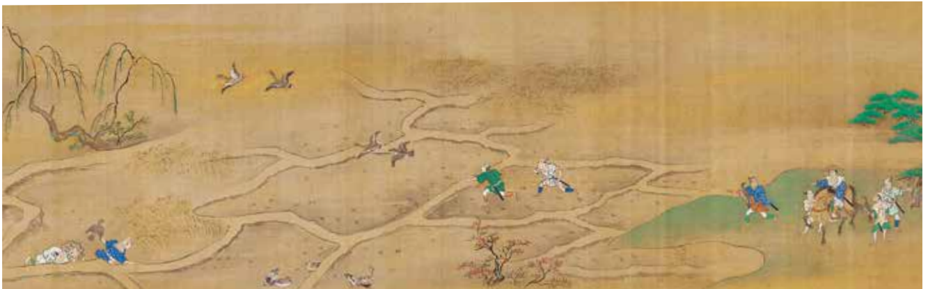
伊達吉村筆「たかがり図巻」(部分) 仙台市博物館蔵