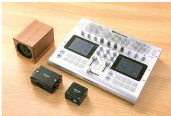
開発した商品の一部。クラウドファンディングで5千万円以上もの出資を集めて開発された「GODJ Plus」(写真右上)は、これ一台でどこでもDJができるため、コアなファンの間で人気を博している。

弊社は設立5年目のスタートアップ企業で、蓄えが十分ではないので、特に首都圏での展示会に出展する際の出展料や旅費、宿泊費に対しての補助金をもらうことができたのは、非常にありがたかったです。さらに現在は、弊社製品の検証実験に関する相談にも乗ってもらっています。これも商工会議所との定期的な情報交換が功を奏した結果だと感じています。