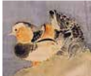
②オシドリ (左が雄、右が雌)