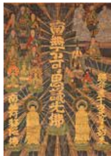
〔光明本尊〕岩手・本誓寺蔵