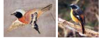
④ジョウビタキ? (写真:雄のジョウビタキ)