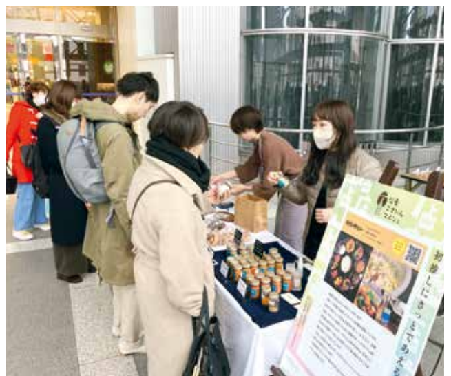
1月に行われた仙臺ございんマルシェの実際の様子。

はないかと推察します。自社の強みを分析し、それを掘り起こして価値を再定義し、顧客にさらに寄り添うことができれば、商品開発のみならず、企業の根本的な改革につながるはず。『ものをつくる』とか、「新しいサービスを提供する」という行為は、あくまで手段の一つです。地元の人々に認知され、愛され、再び輝く商品やサービスを生み出すことが、ただの1発逆転ではなく、本気を示す再挑戦であると考えます。仙台は非常に活力のあるまちです。だからこそ、私自身は仙台からリバイバルや新商品が次々と生まれ、それが大きなムーブメントになるような取り組みに貢献できればと考えています。