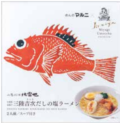
三陸吉次だしの塩ラーメン

弊社は、1963年から国分町で「地雷也」という炉端焼きの飲食店を経営し、キチジの炭火焼きや新鮮な北海道・東北の食材を豪快に提供してきました。地元の皆さまやビジネスマン、海外からのお客さまにもご愛顧いただいておりますが、コロナ禍では厳しい状況が続きました。そのとき、調理やサービスといった現場の人たちの張り合いになるような取り組みはないかと模索していたところ、弊社社長が以前から話していた「おいしいと評判のキチジのダシでラーメンをつくる」というアイデアが浮上しました。キチジの炭火焼きは長年愛されており、お客さまからダシを高く評価していただいていたので、これを使って新商品をつくって