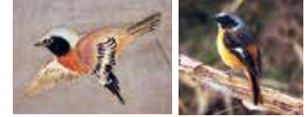
④ジョウビタキ? (写真:雄のジョウビタキ)